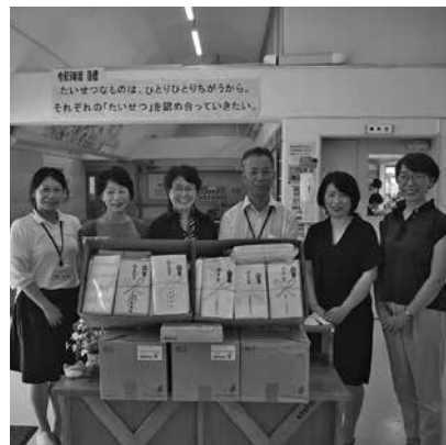
みやま園タオル寄贈

これは社会貢献活動事業の一環として、平成十二年度から毎年女性部会員から寄贈されたカレンダールとタオルを、年二回にわたり桐生みやま園に贈呈しており、今回はタオルを持参した。累計では約四千五百九十六本に達し、同園で役立られている。