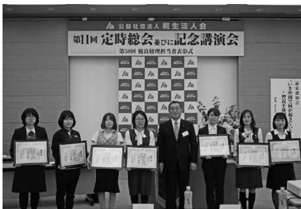
優良経理担当者表彰受賞者