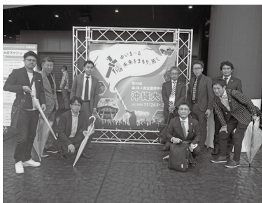
全国青年の集い沖縄大会

大会式典会場の沖繩アリーナには全国から二、〇〇〇名の青年部会員が集い、大会式典では主催者挨拶の後、来賓の方々から祝辞を賜りました。続いて、前日の「租税教育活動プレゼンテーションの結果発表・表彰が行われ、最後に大会実行委員長が「沖繩大会宣言」を読み上げ、次回開催地山形県の大大会長に大会旗を伝達、山形県のPR・紹介をして盛会裡に閉会。