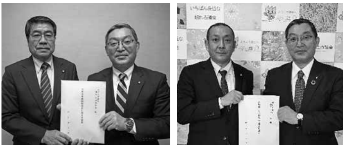
税制改正提言書提出

なお提言書の詳細は桐生法人会 ホームページに掲載されています のでご確認ください。