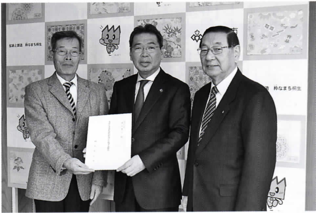
税制改正提言書提出

法人会全国大会で決議された平成二十九年度税制改正に関する提言書を去る十一月二十八日朝倉会長、横塚副会長、生方専務理事の三名が、亀山桐生市長、石原みどり市長、及び桐生市議会議長、みどり市議会議長、井野衆議院議員、石関衆議院議員に提出した。尚、提言書の詳細については桐生法人会ホームページに掲載しておりますのでご覧下さい。