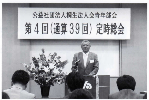
青年部会定時総会

六月二十一日 たつ吉で租税教室研修会を本年は関信越税理士会桐生支部と協働して開催。