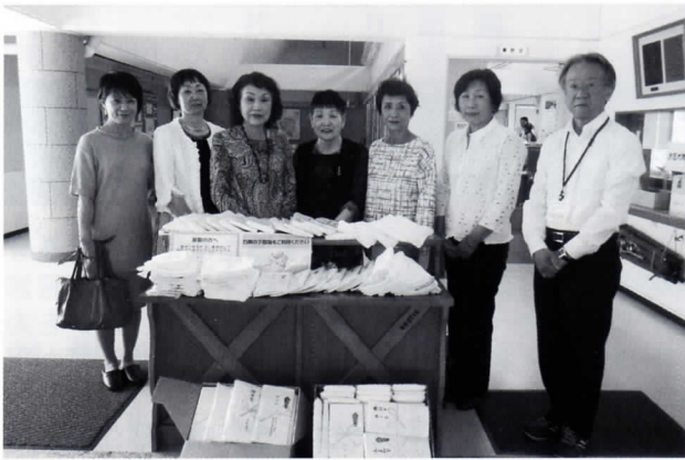
みやま園タオル寄贈

これは、社会貢献活動の一環として、毎年総会時に部会員から寄贈されたタオルをみやま園に贈呈しているもので、平成十二年度から今年で十七回となる。累計では三千三百四十九本に達し、同園で役立てられている。