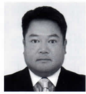
参与 茂 理事