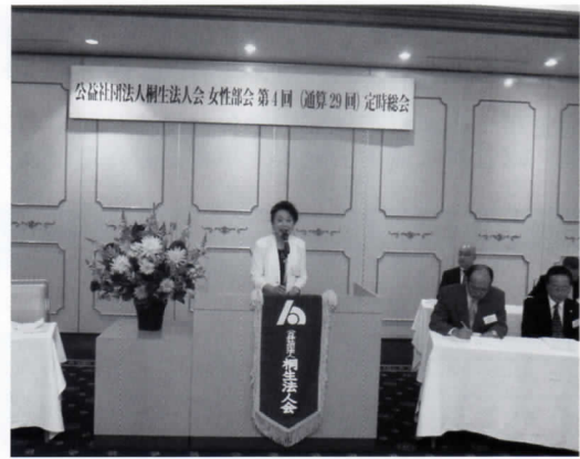
女性部会定時総会

女性部会は、五月十一日桐生グランドホテルにおいて第四回(通算二十九回)定時総会を開催した。総会では、安原税務署長他来賓のご臨席を賜り、高梨部会長を議長に平成二十七年事業報告・決算報告が原案どおり承認。