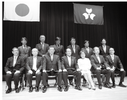
税務功労者表彰式（群馬会館）

令和三年度群馬県税務功労者表彰式が七月二十七日（火）群馬会館二階ホールにおいて挙行されました。