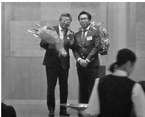
青年部会定時総会