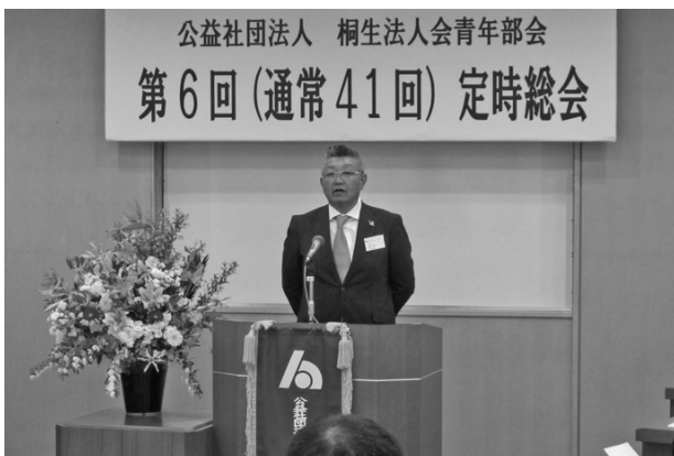
青年部会定時総会